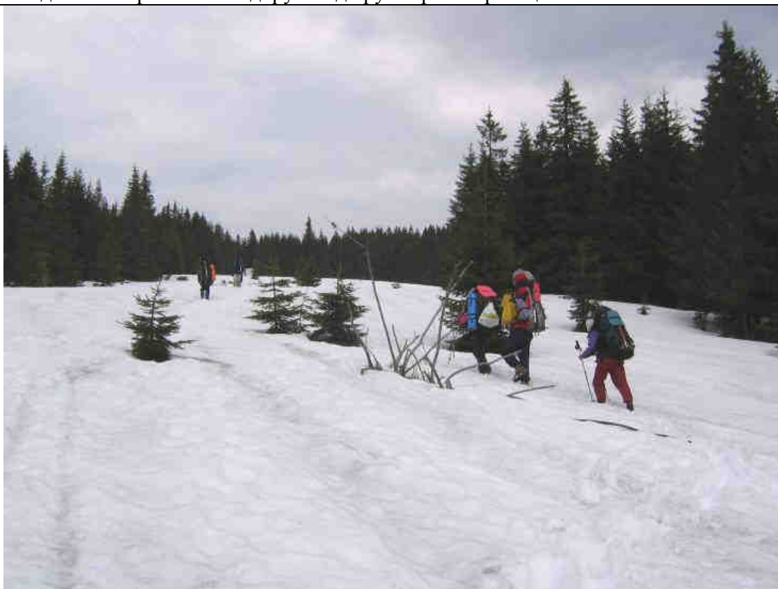
Рис.1. Подъем на полонину Гроппа

Утром начинаем движение от обсерватории спуском на сев.-вост. в долину руч. Погорелец (рис.7-9). Спускаемся сначала траверсом вправо и вниз (крутизна 10-15°), после – прямо вниз (крутизна 15-20°). Идём след в след с самостраховкой ледорубом до русла р.Погорелец.