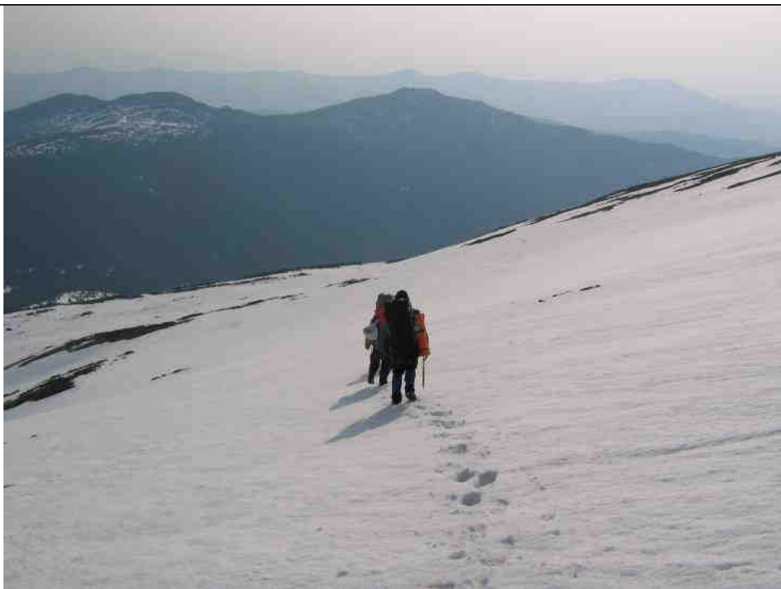
Рис.7. Спуск к р.Погорелец