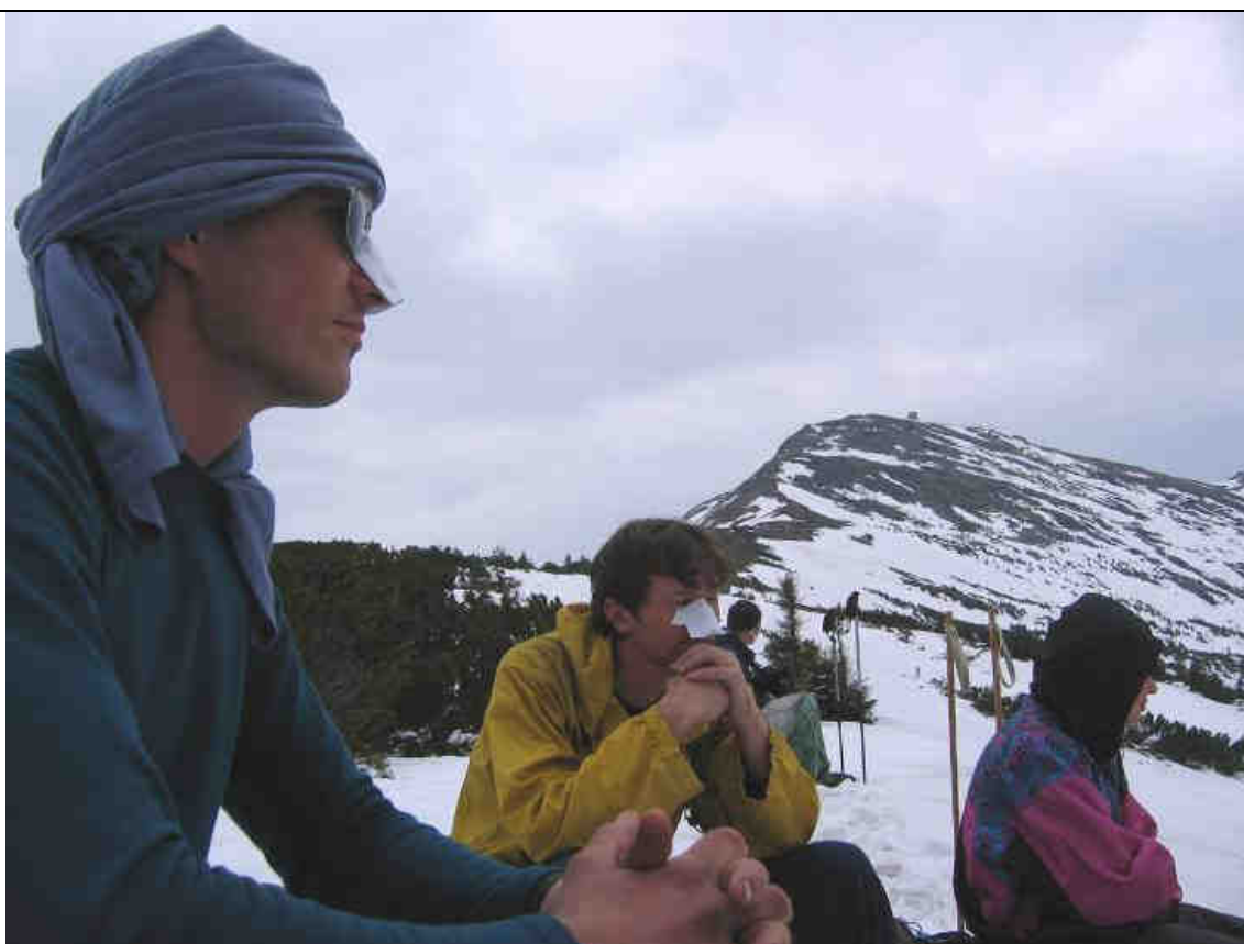
Рис.3. Группа на г.Васкуль