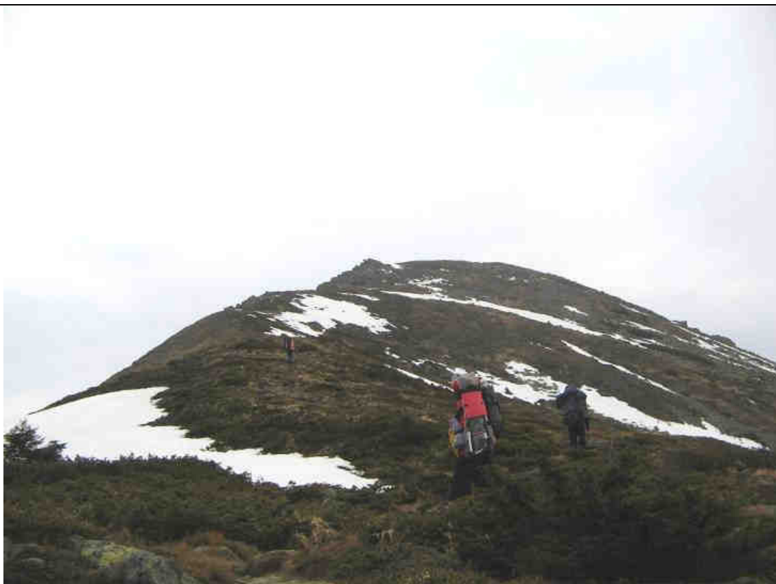
Рис.4. Подъем на г.Поп Иван Черногорский