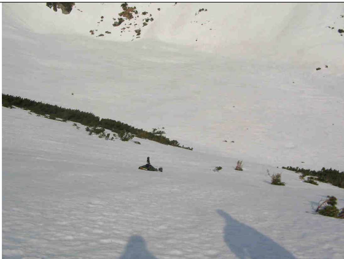
Рис.8 Спуск к р.Погорелец