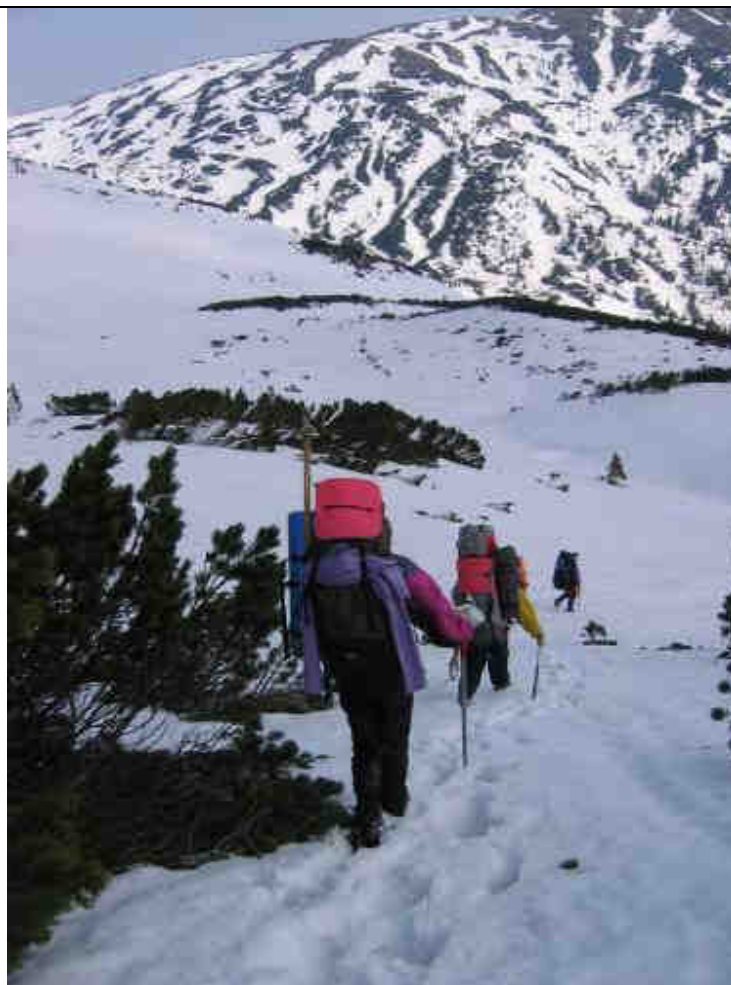
Рис.9. Спуск к р.Погорелец