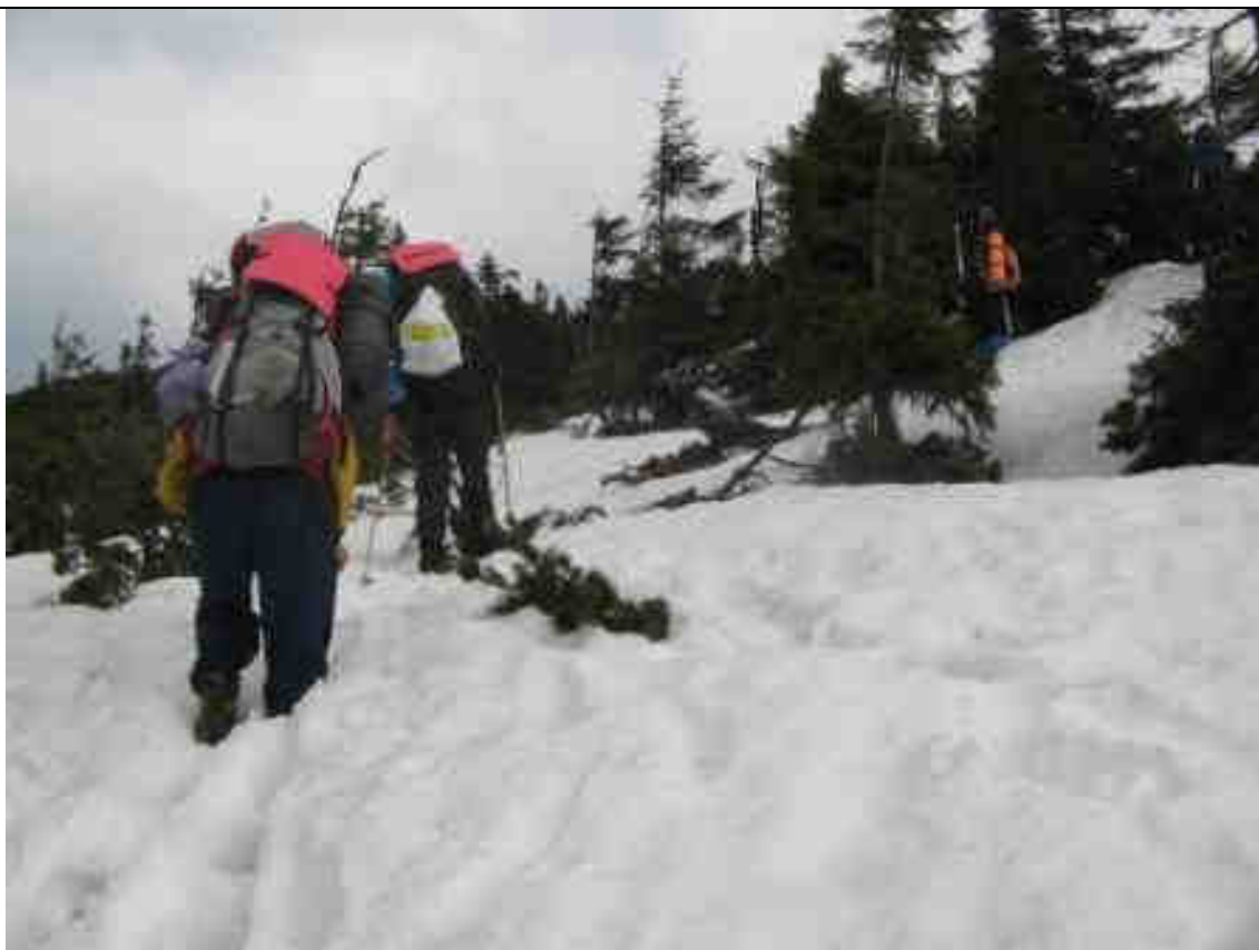
Рис.2. Подъем на полонину Гроппа