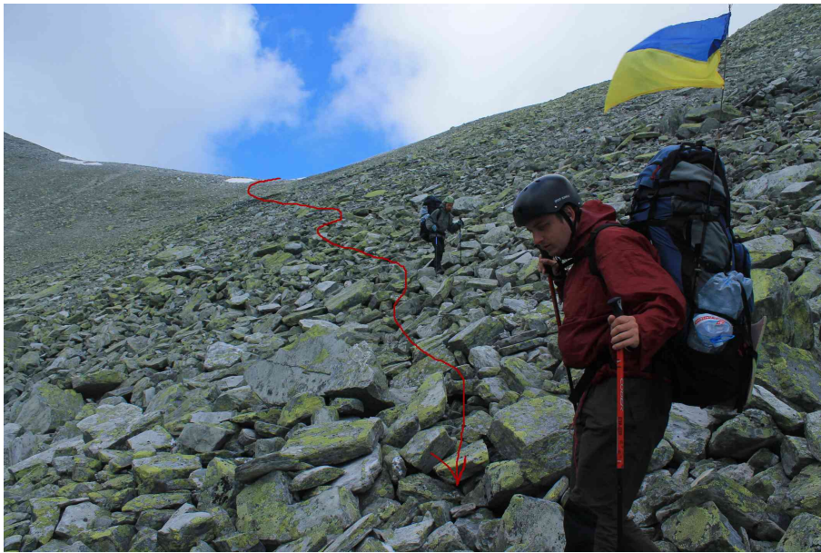
Вид на перевал з півдня: