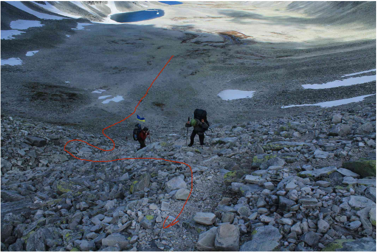
Фото на перевалі: