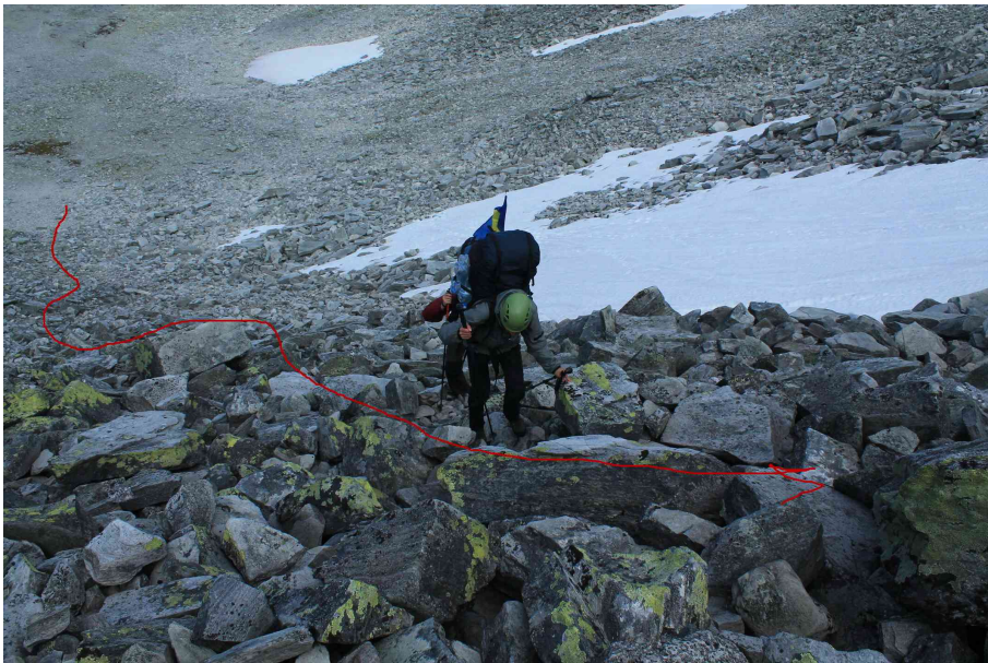
Шлях до перевалу з півночі: