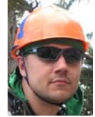
Кушниренко Юра Фотограф