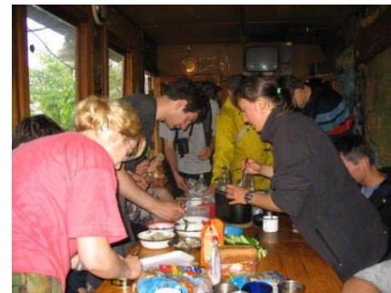
Обед в КСО

Спускаемся на дикий пляж возле тренировочного скалодрома. Плюхаемся в воду. МАМОЧКИ! Она же ХОЛОДНЮЧАЯ! Девчонки резво, насколько позволяет галечный пляж, выскакивают из воды. Ребята продолжают гордо рассекать волны. Бр-р-р-р-р. Но и им потихоньку надоедает изображать моржей. Наконец все выбираются из воды. Приползаем в