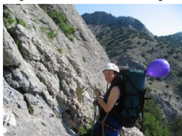
Я и гравицапа