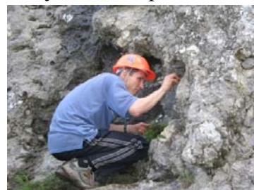
Вылазь, кому говорят!