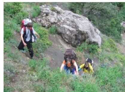
Подход к маршруту