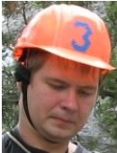
Подольский Женя Фотограф