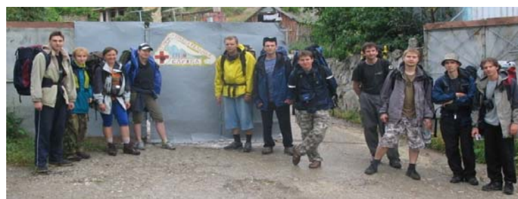
Группа возле КСО г.Судак

Сюрприз номер два – автобус на Судак уехал 15 минут назад, следующий где-то через