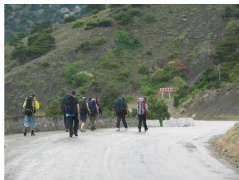
По дороге к Соколу