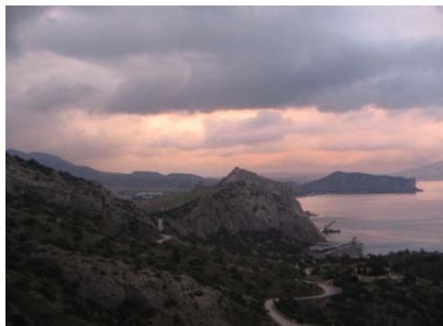
Вид с Сокола – Генуэзская крепость

Ну ладно. Будет вам море. Берем полотенца, купальники, топаем на пляж. Поскольку стемнело окончательно – топаем с фонариками.